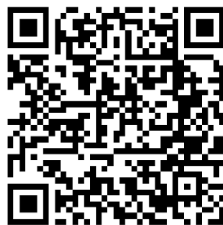
YouTube Smart FMS